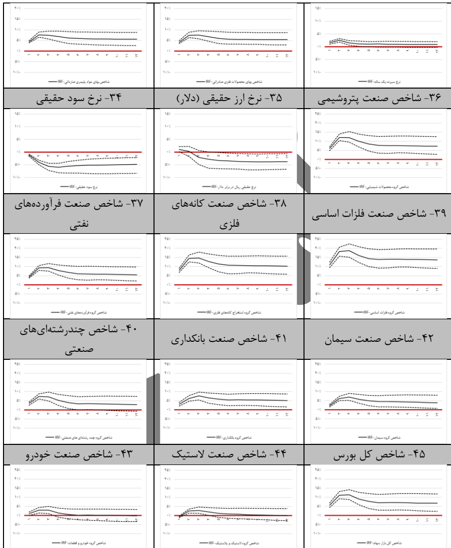
شکل ۲: توابع کنش-واکنش متغیرهای الگو به تکانه قیمت نفت

همان‌طور که در بخش ۱ شکل (۲) نمایان است، یک انحراف معیار تکانه قیمت نفت باعث افزایش آنی قیمت نفت به میزان ۱۴ درصد می‌شود، سپس طی سه فصل رشد قیمت نفت به سطح ۲۰ درصد می‌رسد و مجدداً اندکی تعدیل می‌گردد و در نهایت در سطح ۱۸ درصد تثبیت می‌شود. اکنون